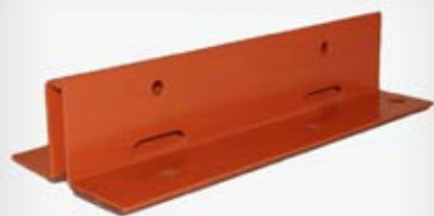
Indeks artykułu: UNT URS