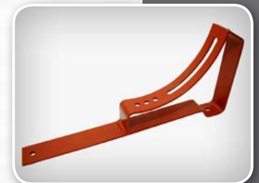
Indeks artykułu: UNT WB35, UNT WB40