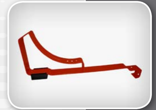
Indeks artykułu: UNT WDZ