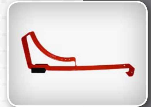
Indeks artykułu: UNT WDK