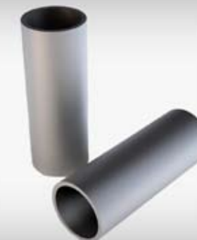
Indeks artykułu: UNS RP1, UNS RP2