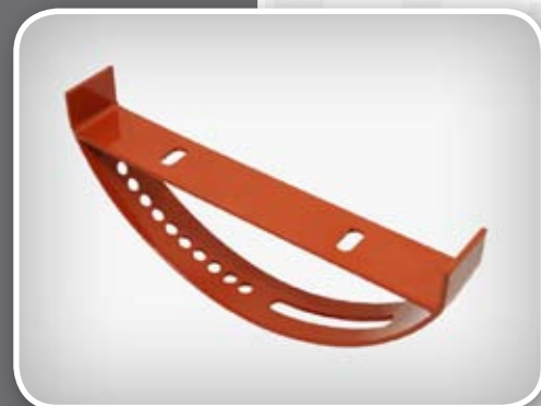
Indeks artykułu: UNT MLK