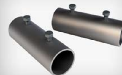
Indeks artykułu: UNS LR1, UNS LR2