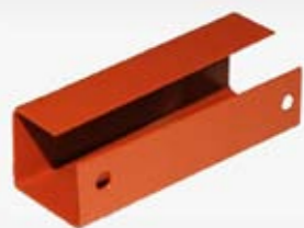
Indeks artykułu: UNS LP2