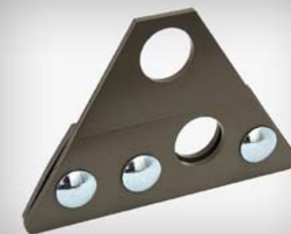
Indeks artykułu: UNS WRR1, UNS WRR2