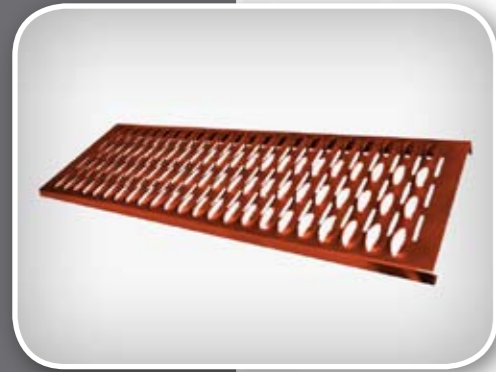
Indeks artykułu: UNT L04, L06, L08, L10, L20, L30