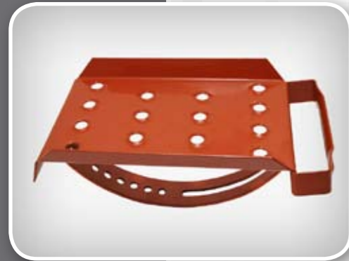
Indeks artykułu: UNT ST2